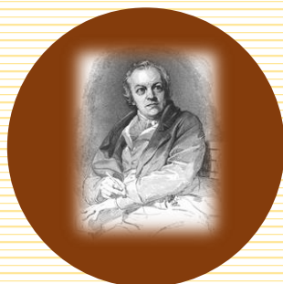
William Blake 1757-1827 英国の詩人、画家、銅版画家